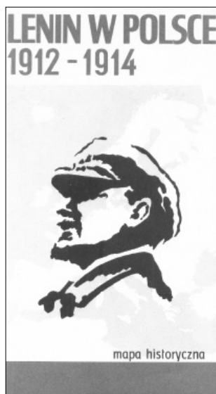
Ryc. 4. Okładka mapy Lenin w Polsce 1912–1914 wydanej przez PPWK w 1970 r.

Osobliwą publikacją o wymowie propagandowej jest historyczna mapa Lenin w Polsce 1912–1914 (1970). Świadczy o tym już sam fakt jej wydania. Opracowanie stanowi odwołanie do pobytu przywódcy bolszewików na ziemiach polskich, mimo że jako podkład mapy zastosowano podział polityczny Europy w roku jej wydania. Postać Lenina przypomina okładka, na której umieszczony jest jego wizerunek (ryc. 4). Na mapie oznaczone są na czerwono miejsca pobytu