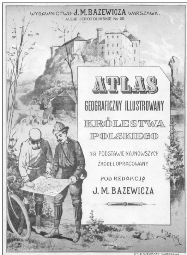
Ryc. 1. Strona tytułowa Atlasu geograficznego ilustrowanego Królestwa Polskiego J.M. Bazewicza z 1908 r.

rodaków naszym krajem własnym, zachęcenie ich do poznania go i ukochania”. J.M. Bazewicz zastosował w atlasie polskie nazewnictwo, mimo że nie istniało wówczas oficjalnie państwo polskie. Poprzez wprowadzenie ilustracji przedstawiających najciekawsze zabytki i krajobrazy ziem polskich oraz stroje ludowe z danego regionu autor „pokazywał” naród polski, propagował jego zwyczaje i tradycje.