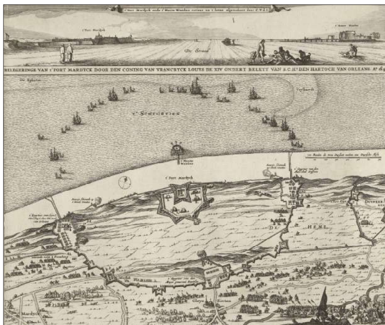
Ryc. 2. Oblężenie Fortu Mardijk, 1645 r.

Jej oryginalny tytuł to: Belegeringe van t' Fort Marduyck door den Coning van Vrancryck Louys de XIV ondert beleyt van S.C.Ho. den Hartoch van Orleans. Ao. 1645 [Oblężenie Fortu Mardijk przez króla Francji Ludwika XIV, (prowadzone) pod dowództwem księcia Orleanu w roku 1645]. Wymiary: długość 370 mm × szerokość 436 mm; orientacja północna. Arkusz papieru podzielono na dwie różnej wielkości części. Główna rycina przedstawia Fort Mardijk, jego fortyfikacje oraz oblężenie od strony łąd i morza. Dostrzec można francuskie obozowiska