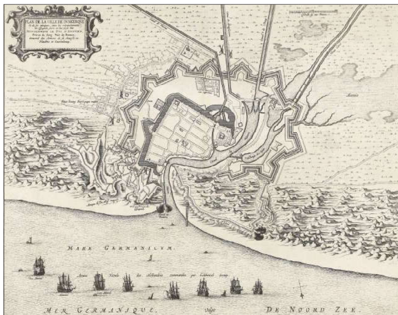
Ryc. 3 Plan oblężenia Dunkierki przez księcia Enghien w 1646 r., wydany przez Johanna Willemsoona Blau'a, datowany na lata 1649–1652 (Rijksmuseum w Amsterdamie)

łacińskim, francuskim i niderlandzkim. Zobrazowano osiem okrętów wojennych, podpisanych po francusku jako holenderska flota wojenna dowodzona przez admirała Trompa. Trzy okręty od lewej opisano jako jednostki flagowe – wiceadmirała, admirała i kontradmirała. W lewym górnym rogu znajduje się ozdobny kartusz, w którym umieszczono francuskojęzyczny tytuł. W prawym górnym rogu skała („Eschelle de 200 Thoizes”). Plan ma orientację południową. U góry jest południe ku zachodowi (SbW). Perspektywa z morza w kierunku linii brzegowej.